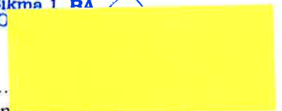
Viliam Blonoh štatutárny zástupca