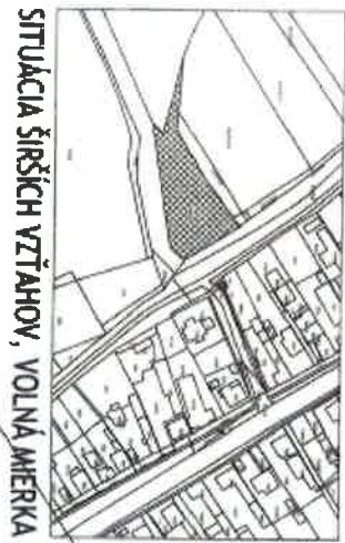
SITUÁCIA ŠIRŠÍCH VZŤAHOV, VOLNÁ MERKA