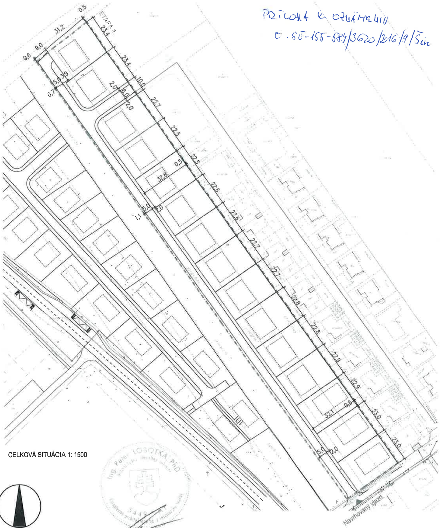
CELKOVÁ SITUÁCIA 1: 1500

PRÍLOHA K OZEMNEMU Č. SÚ-155-584/3620/2016/9/SÚ